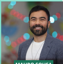
MAURO SOUSA @maurosousa

CONFERENCIA LEGADO VIVO: CÓMO MANTENER LA CULTURA, LA RELEVANCIA Y LA ADAPTACIÓN AL MUNDO ACTUAL ATRAVÉS DE LAS GENERACIONES | SESSION "LIVING LEGACY: PRESERVING CULTURE, RELEVANCE, AND ADAPTATION ACROSS GENERATIONS IN A CHANGING WORLD